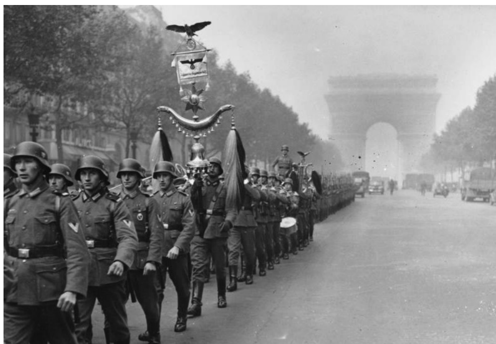
Tropas alemanas de ocupación desfilando en los Campos Elíseos.