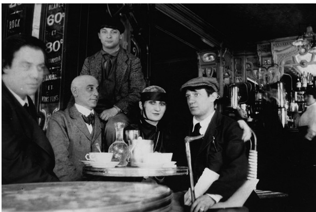
Manuel Ortiz de Zárate, Moïse Kisling, Pâquerette y Picasso en el café La Rotonde de Montparnasse, 1916.